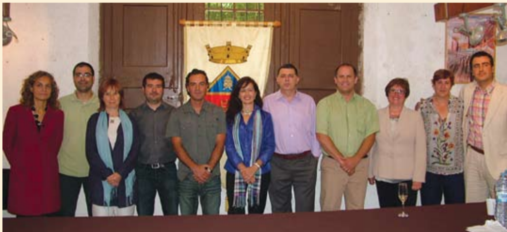
Composición del actual consistorio de Collbató, con un total de 11 concejales: 4 del PSC, 3 del GIC, 2 de CiU, 1 d'ERC i 1 del PP

El sábado 11 de junio se constituyó el nuevo Ayuntamiento de Collbató.