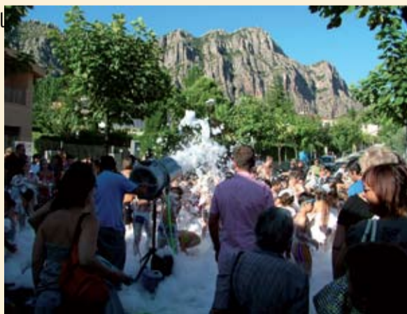
"Imagen de la Fiesta Mayor"