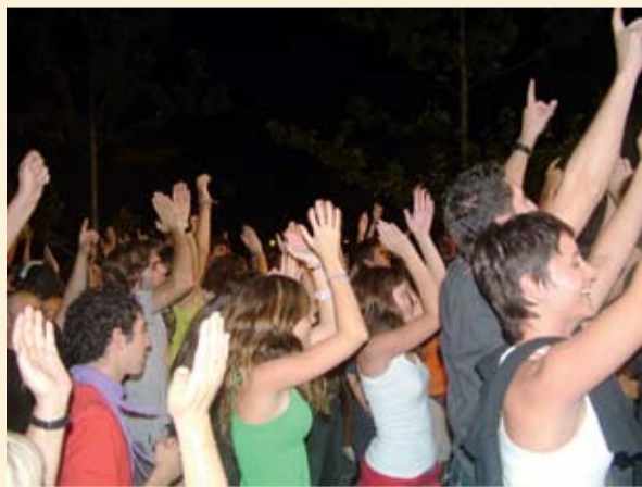
"Imagen de la Fiesta Mayor"

Felicidades , porque, a pesar del poco tiempo que hemos tenido para preparar las fiestas, debido a las elecciones, a las conversaciones previas al pacto, a la formación del nuevo gobierno, etc ... pensamos que hemos salido airosos. Esta es la sensación que compartimos un servidor y la sustituta temporal de técnica de Cultura, con quien durante estos días hemos compartido actividades y hemos recibido numerosas expresiones en positivo. Por ejemplo, el retorno de las actividades principales a la pista deportiva, ahora ya cubierta, se ha considerado un acierto, como también lo ha sido, el hecho de distribuir alrededor de dicho espacio central, las atraccio-