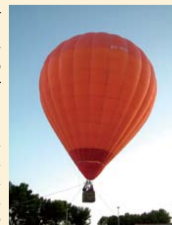
"Imagen de la Fiesta Mayor"

Por último, quisiéramos hacer una mención especial a la Fiesta Mayor Joven, ya las actividades que desde la Barraka Jove se han llevado a cabo estos días, en especial la Carrera de los Trastos y el Baloncesto 3x3, y sobre todo la excelente y fantástica Fiesta organiza-