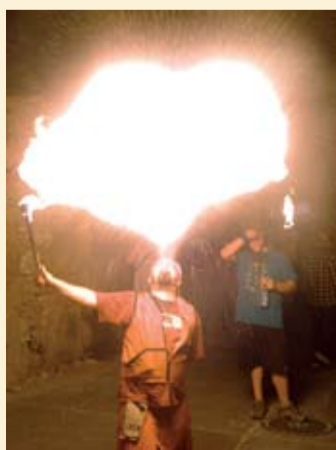
"Imagen de la Fiesta Mayor"

Gracias , a todos los que han ayudado a que esta Fiesta Mayor haya sido posible: compañeros concejales y alcalde, técnica Judit Jorba, que ha realizado un trabajo excelente, Brigada Municipal, con una gran dedicación y esfuerzo, Guardia Municipal, siempre a punto; entidades, que en todo momento han ayudante organizando actividades populares, como la bicicletada, la carrera de atletismo o las consolidadas ginkana nocturna o tómbola parroquial. Gracias, también, por supuesto, a las personas que durante estos días han ayudado en las tareas de los bares, lo