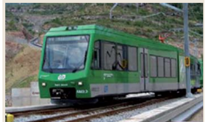
Cremallera de Montserrat

Descuentos en el Cremallera de Montserrat. Los vecinos y vecinas de Collbató que deseen obtener un 40% de ahorro en el billete del Cremallera de Montserrat, pueden obtenerlo solicitando el correspondiente carné al Ayuntamiento de Collbató; únicamente es necesario estar censado en el municipio.