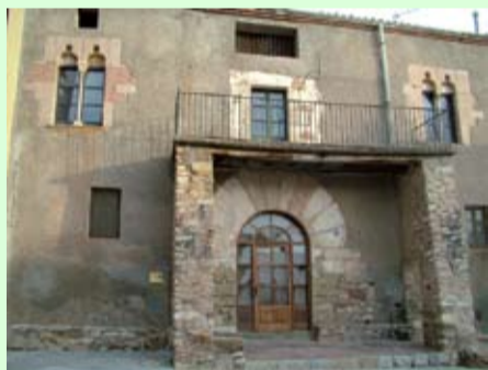
"Cal Tutor, en la plaza de l'Església, uno de los edificios catalogados más destacados de Collbató"

El pasado 27 de septiembre la Oficina de Patrimoni de la Diputació de Barcelona, entregó el documento definitivo con el Mapa de Patrimonio de Collbató.