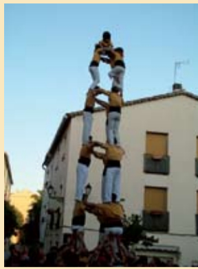
"La exhibición castellera siempre presente en Collbató con motivo de La Diada"

Al finalizar el verano han finalizado también diversas fiestas populares y culturales del pueblo. Resumida la Fiesta Mayor en el anterior boletín, ahora es el momento de prestar atención a la segunda parte de este verano cultural.