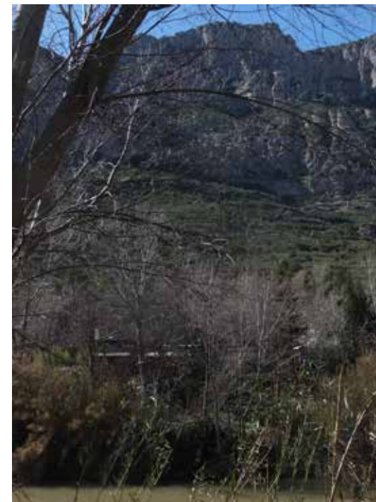
Imatge que visualitza els dos hàbitats principals, el de ribera i el de l'àmbit de la muntanya de Montserrat