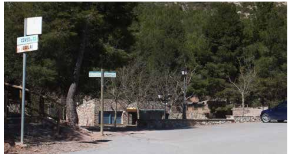
Àrea d'esplai de La Salut, un indret clau en l'accés a les coves del Salnitre i també com a punt de sortida d'itineraris cap al parc natural de Montserrat.

Preservar i restaurar el patrimoni arquitectònic (vinculat a l'oli, a la pedra, a l'aigua) per tal d'incrementar el sentit de pertinença al municipi.