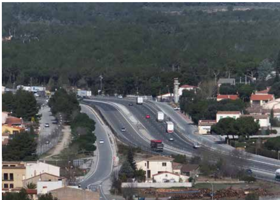
Tram de l'autovia A2 al pas per Collbató. El desnivell que s'aprecia en aquest tram va associat a una contaminació atmosfèrica i acústica més destacada.

Correspon a la franja a banda i banda de l'autopista en tot el sector proper a les zones urbanes. En aquesta zona de transició, l'impacte de la contaminació acústica i atmosfèrica sobre la població és molt notable i la vegetació pot contribuir a reduir-lo.