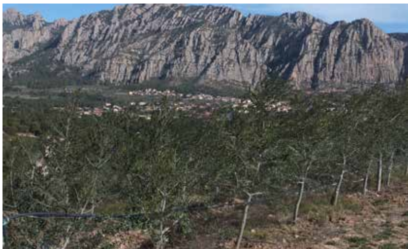
El manteniment de conreus llenyosos té grans beneficis a diferents nivells: ecològic, econòmic, paisatgístic i cultural.

El 1994, quan el foc forestal va cremar més del 40% del terme al mateix sector nord-oriental.