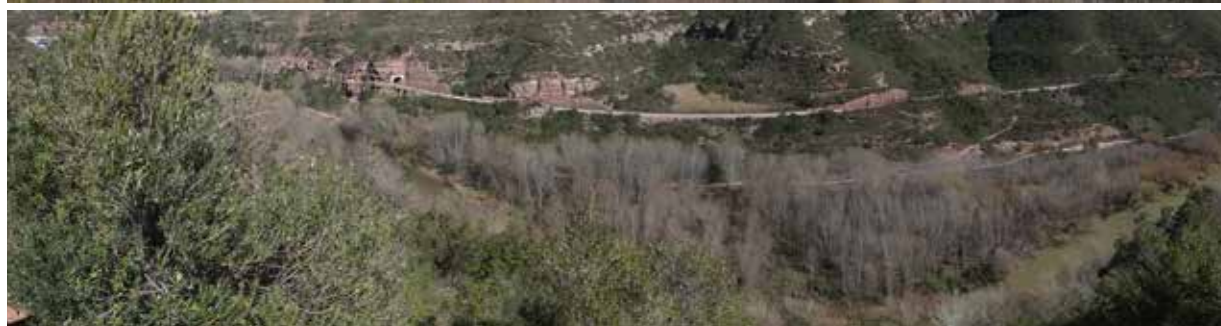
Paisatge agrícola del Pla de can Martí Joan i la Vinya Vella. Un paisatge agrícola amb brots d'urbanització difusa.